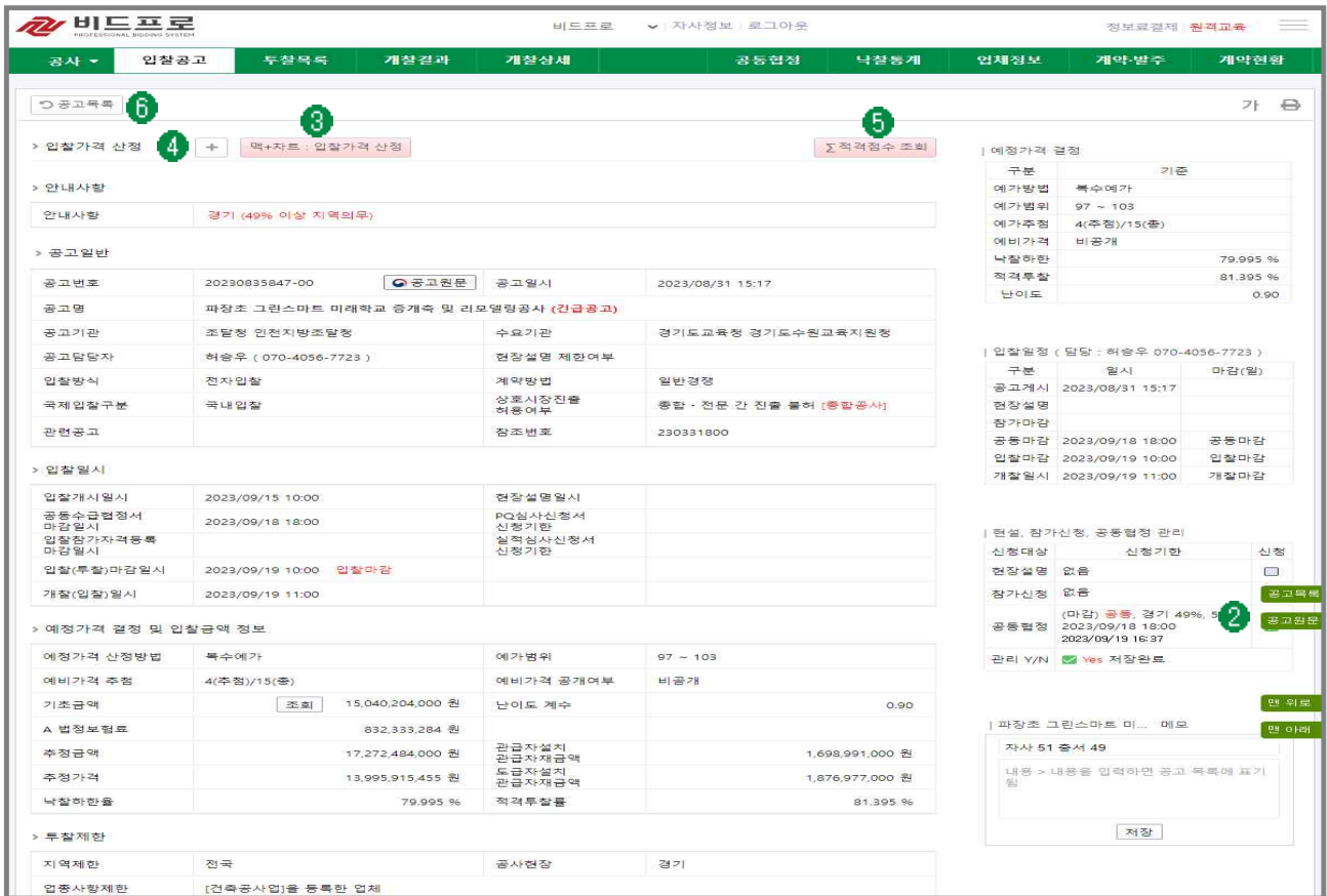
[그림 4] 입찰공고 상세정보